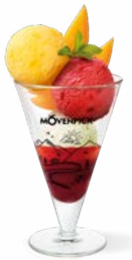
TRIO DE SORBETS

3 Kugeln Mövenpick Sorbet, Beeren - und Fruchtsauce und Dekoration Fr. 13.50