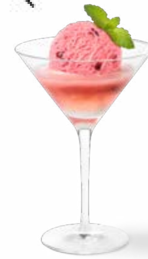
SORBET, VIEILLE PRUNE

1 Kugel Schweizer Zwetschgen Sorbet, Vieille Prune Fr. 13.50