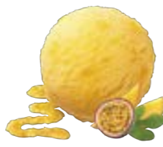
PASSION FRUIT & MANGO