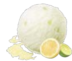
LEMON & LIME